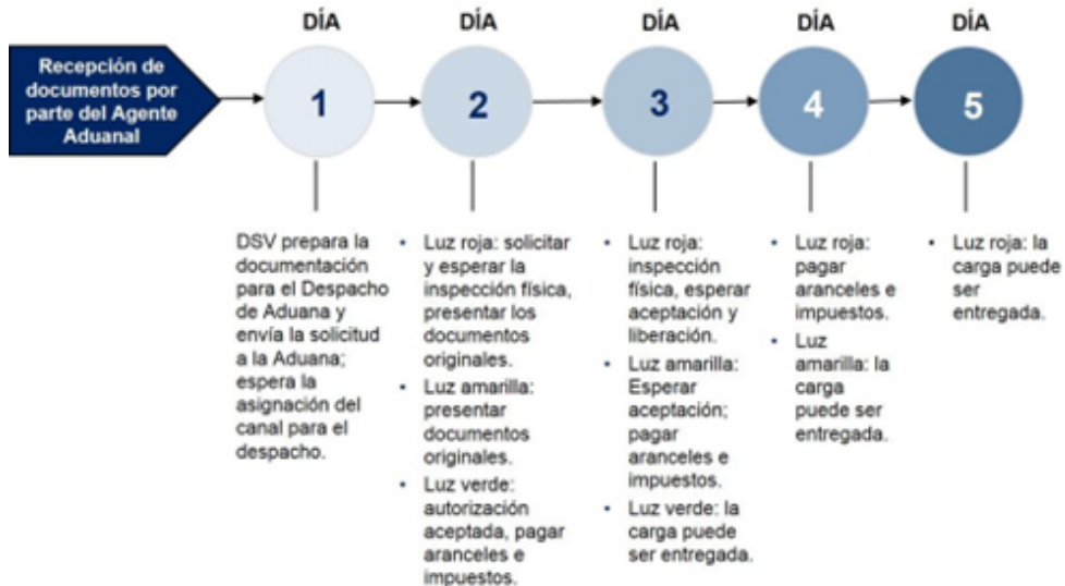
Figura 2. Tiempo de despacho aduanero marítimo en Perú

Nota: Base de datos de (SUNAT, 2018) y (DSV Perú, 2021)