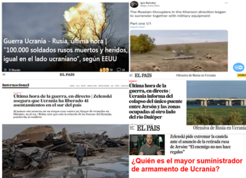
Figura 7. Balance de la guerra I