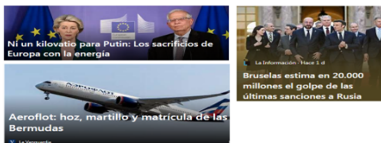
Figura 11. Balance de la guerra V

estamos además sobre endeudados en fin, va a ser tremendo, aún estoy esperando efectivamente ver los efectos con las divisas digitales porque es verdad que salvo el tema de los rublos, ya que a Rusia le siguieran pagando el gas y el petróleo en rublos, y además al dejar de utilizar los dólares, ha hecho que también se desplome del Euro frente al Dólar, ya no solamente porque la Reserva Federal haya subido los tipos de interés, sino porque ahora mismo se está revalorizando el dólar, pues nos sale muchísimo más caro de ahí que al final pues aunque empiecen ya a bajar los precios, nos sigue saliendo carísima la gasolina. En fin, ya les digo que todas las sanciones que se han tomado desde la Unión Europea en realidad miren, las compañías aéreas lo que han hecho ha sido matricularse en Bermudas y ya está, por otro lado, lo que hacen es que todo el gas y el petróleo lo compra India y luego nos lo revende. Por su parte, Rusia tampoco puede coger y ponerse a vender a otras partes del mundo, porque en realidad los gasoductos los tiene tendidos hacia Europa, entonces, hasta que se construya y pueda realmente pasarles a China e India, etc., pasará mucho tiempo, por tanto, en cierto modo todos estamos entrampados.