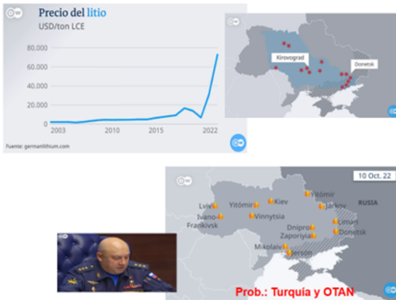
Figura 4. Depósitos de litio

trabas Macron, y diciendo que bueno, no se puede humillar a Putin, hay que darle una salida, por tanto ahí siempre tenemos en Europa esa quinta columna. Por último, temas de geopolítica lo vamos a ver en los bloques, que no solamente es una cuestión de intereses económicos, sino también la superioridad moral y cultural, lo que está en juegos es qué modelo vamos a tener porque además hay un cambio del Orden Mundial, y por tanto democracia duras o como los queramos llamar. Rápidamente aquí tienen (vid. diapositiva).