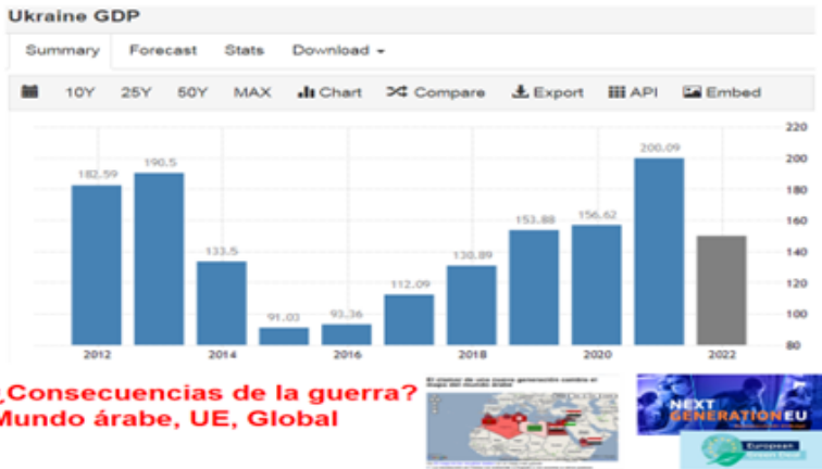
Figura 9. Balance de la guerra III