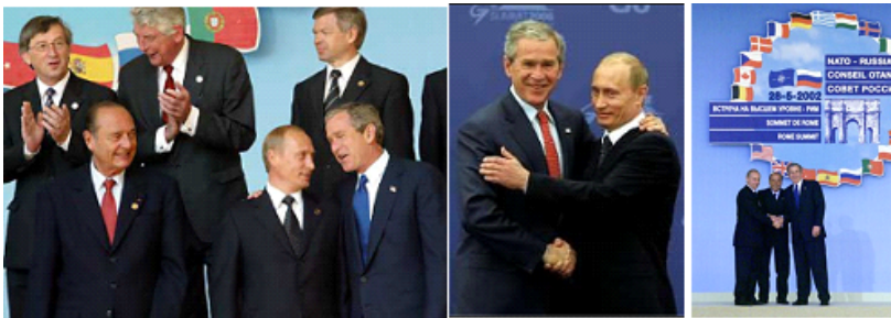
Figura 16. Imágenes y datos que matan el relato I

Son muchos los puntos tratados por el otro ponente, que merecen una reconsideración (incluso una rectificación), pero empezaré por lo planteado por el moderador: Rusia sí fue candidata a entrar en la OTAN (véase la foto de Putin y Bush en el año 2002), planteándose incluso su incorporación al proceso de integración europea, en concreto, en la Unión Europea (desde 1992 con el tratado de Maastricht, cuando se prevé que vaya a tener personalidad jurídica, pero no se perfecciona hasta el Tratado de Lisboa y su entrada en vigor en 2009).