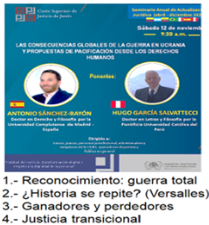
Figura 1. Sumario