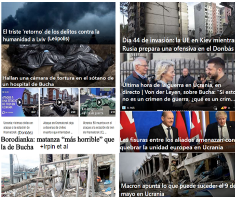
Figura 14. Resultados de la guerra III

Charles Michelle (Presidente del Consejo Europeo, que es el típico burócrata europeo que también ha sido del Ejecutivo Belga), o Ursula von der Leyen (Presidenta de la Comisión Europea); son estos, quienes al adoptar e implementar el discurso socialista del Green Deal (Pacto verde), nos han metido en la carestía energética, un despunte inflacionario, un gran endeudamiento y la trampa de la deuda con China (que ya es descomunal). Análisis iushumanista... o iushumanitario mejor En lo que es materia de Derechos Humanos (Sánchez-Bayón, 2010 y 2020; Sánchez-Bayón et al, 2013 y 2018a-b), sobre el tema de la invasión de Rusia a Ucrania, es evidente, aunque quizá sería mejor (dada la guerra en curso) el analizarlo desde la perspectiva del Derecho Humanitario. Este es el Derecho que debería imperar en cualquier conflicto, respetándose la normativa de ius cogens u obligatoria para todos, por lo que cabría hablar ya de delitos de lesa humanidad. A tal respecto, Rusia podría aclarar que no ratifico el tratado de Roma, de la Corte Penal internacional, pero se insiste en que se trata de ius cogens, y por ello la Fiscalía viene instruyendo una investigación, porque al final, al ser delitos de lesa humanidad, se puede terminar enjuiciando y exigiendo responsabilidades personales, a aquellos que efectivamente tomaron las decisiones bélicas, como se hizo en su momento con otro amigo de Putin como fue Milosevic 22 , con todo lo que ocurrió en los Balcanes.