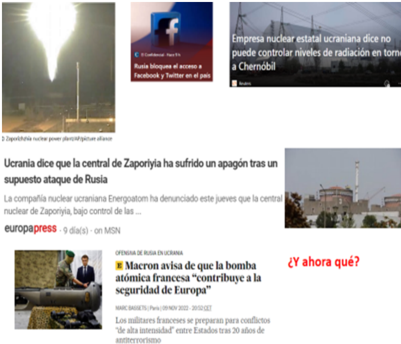
Figura 15. Resultados de la guerra IV

Como puede constatarse en las fotos (v.g. torturas, fosas comunes), resulta que en Ucrania se ha cometido grandes atrocidades sobre todo en Leopoldis, Mariupol, etc. Ha habido auténticas barbaridades y sobre todo contra civiles, pero repito por eso cuidado también con la terminología como llamamos al fenómeno y según la situación en la que estamos (vid. presentación al inicio). No sé si esto crece, vengan los ataques nucleares, el armamento nuclear que tiene Rusia no es de última generación, no me extrañaría que incluso hasta les pudiera accidentar a ellos al intentar lanzarlo, nosotros tenemos escudos que pueden frenar cualquier tipo de ataque, en ese sentido a mí me preocupa más la situación de las centrales nucleares como la de Zaporíya, que tiene 5 o 6 grandes reactores, y por los bombardeos se han quedado sin electricidad y con ello sin posibilidades del mantenimiento, lo que puede causar la fisión del núcleo y, ahí podemos tener un problema muy gordo.