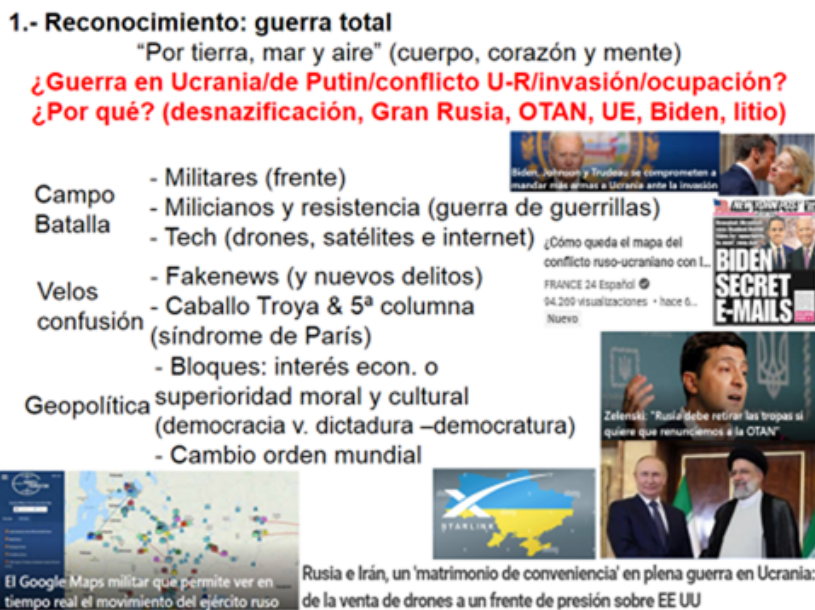
Figura 3. Valoración de la guerra

se aludió a los tratados internacionales favorecedores de la reunificación alemana, donde se renunciaba al avance hacia el este de la OTAN, sin embargo, se insiste, fue firmado por otros actores. Por último, ¿desde cuándo un país, de manera imperialista, puede impedir a otros que ejerzan su soberanía? ¿A caso Ucrania no puede incorporarse a la Unión Europea y a la OTAN sin permiso de Rusia? (entonces estaríamos negando el Derecho Internacional). Ningún país puede imponerle a otro unas condiciones de ese tipo. Además eso fue con la URSS, que ya se extinguió, luego Rusia no tiene que decir nada a ese respecto (sobre la posible entrada de Ucrania en la OTAN y/o la Unión Europea); sin embargo, tal cosa sí se le prometió a Ucrania por parte de la comunidad internacional, en reiteradas ocasiones, y por ello, Ucrania permitió que se ocupara parte de su territorio (Crimea), la entrega de armas nucleares, y tuvo lugar EuroMaidan (manifestaciones populares a favor del ingreso en la Unión Europea) –tal como se puede ver en las imágenes–.