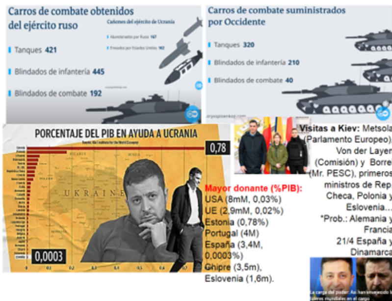
Figura 8. Balance de la guerra II

que todo mayor de 18 años se tenía que quedar a combatir, salvo que tuvieras 3 hijos o más y, entonces, si te dejan irte con tu familia. Luego de tales medidas, el Ejército ucraniano desplegó su contraofensiva, y están recuperando más de 41 localidades, van a una media de no menos de 10 km a la semana, porque también hay campos minados, se van volando puentes también, etc. Hay una imagen en Twitter que cambió la percepción, que eran pues los rusos ya les digo, si es que los pobres tampoco sabían dónde iban y además les estuvieron bombardeando con propaganda de que los ucranianos son rusos también, y vamos a ayudar a nuestros hermanos rusos etc., claro, cómo van a disparar a ucranianos, entonces, se encontraron en una situación tremendamente loca y aquí lo que están es desde un tanque pidiendo rendirse con la ropa interior, que es la bandera blanca. Pero bueno ¿Sabían quiénes han sido el mayor suministrador de armamento de Ucrania en esta guerra? pues lo crean o no ha sido Rusia.