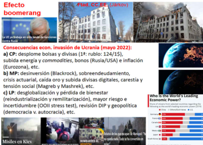
Figura 10. Balance de la guerra IV