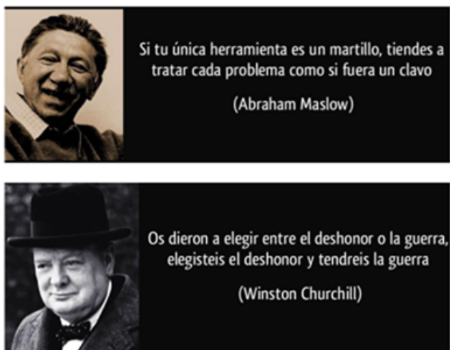
Figura 2. Reflexiones preliminares