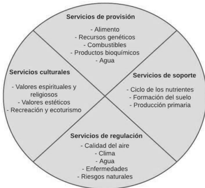
Figure 1. Servicios Ecosistémicos