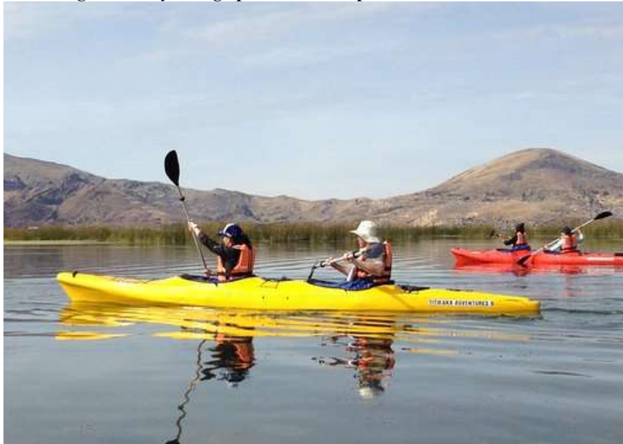
Figura 3. Kayacking –península de capachica-LLachón