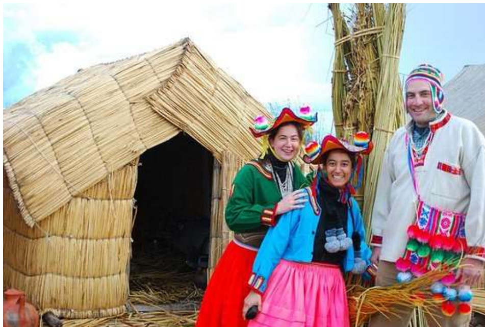
Figura 4. Turismo vivencial en la Isla de los Uros

Recursos naturales que cuenta la region son: Aguas termales del Puente Bello, y de Collpa Apacheta (Pichacani). - Aguas termales de Jesus Maria (Tiquillaca). - Arte rupestre de Ccota (Plateria). - Camellones o Waru Warus (Puno). - Cataratas de Totorani (Puno). - Comunidades de Ichu, Chimu y Ojerani (Puno). - Comunidades de Llachon, Ccotos (Capachica). - Gigantes de piedra en Jallihuaya (Puno). - Isla Amantani, Isla Taquile (Amantani). - Lago Titicaca. - Laguna Umayo (Atuncolla). - Machakmarca (Acora). - Mirador natural cerrito Huajsapata (Puno). - Península de Capachica (Capachica). - Península de Chucuito (Chucuito). - Playas de Karina y Churo (Chucuito). - Playas de Charcas, de Titilaca y de Huencalla (Acora). - Playas de Llachón y Chifrón (Capachica). - Reserva Nacional del Titicaca (Puno). (Plan estratégico regional de turismo puno - PERTUR 2021).