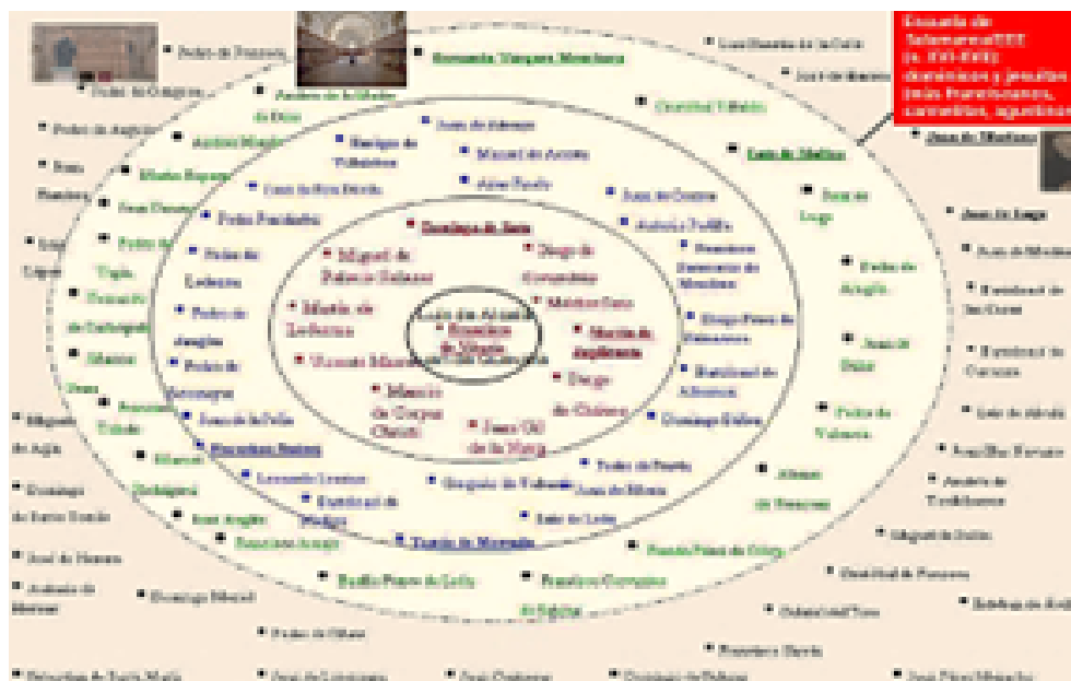
Figura 1. Generaciones de EEE