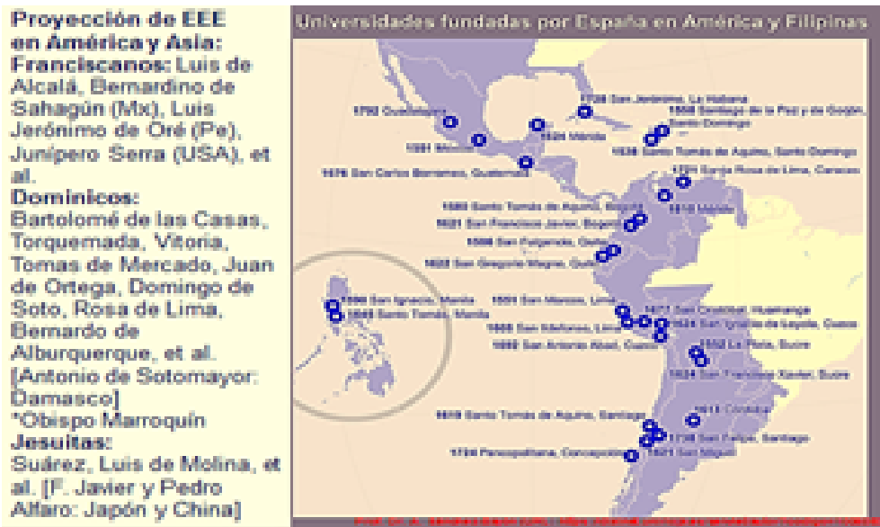
Figura 2. Influencia geográfico-cultural de EEE